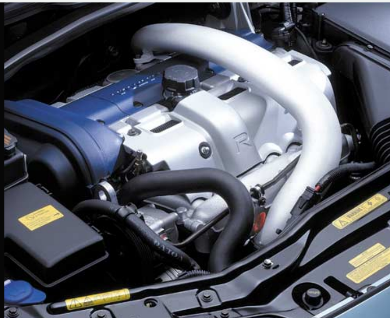
Motor met blauw kleppendecksel en R-logo