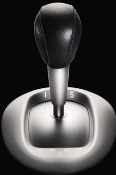
6-speed handgeschakelde versnellingsbak (spaceball)