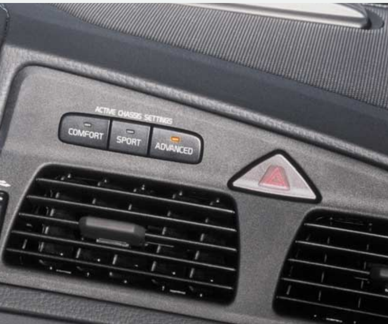
Four C systeem (Active Chassis-settings)