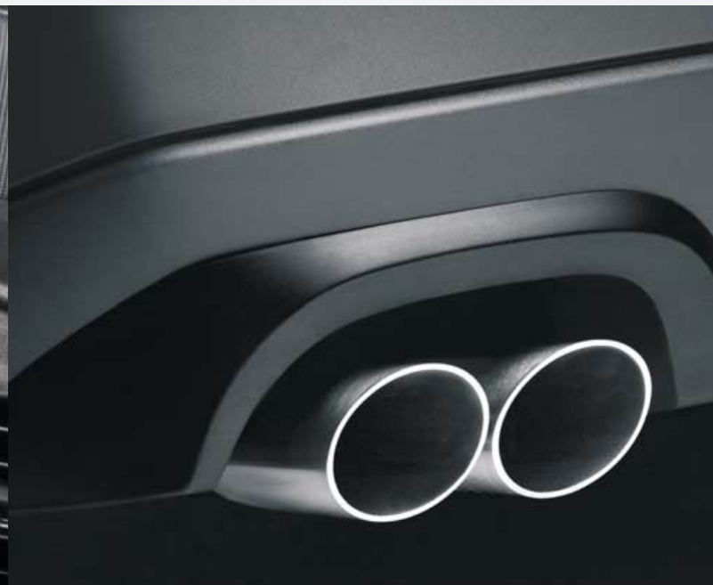
Dubbel uitgevoerde uitlaatpijp