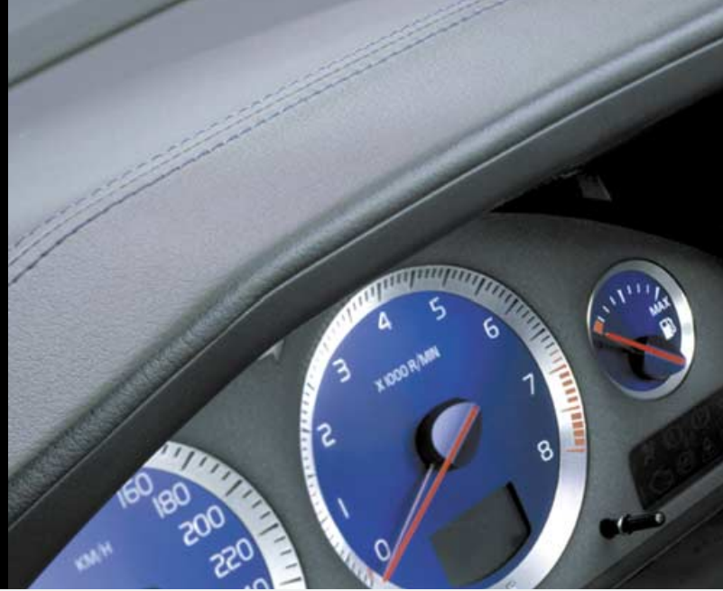
Wijzerplaten instrumentenpaneel in blauw uitgevoerd (R-type)