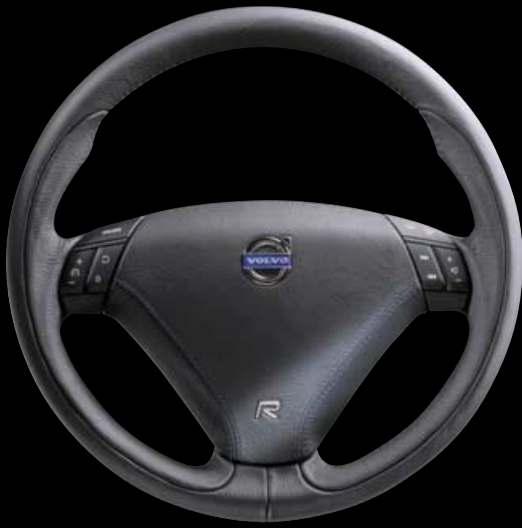
Leder bekleed 3-spaaks sportstuurwiel (R-type)