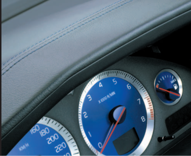
Wijzerplaten instrumentenpaneel in blauw uitgevoerd (R-type)