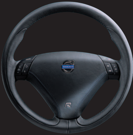
Leder bekleed 3-spaaks sportstuurwiel (R-type)