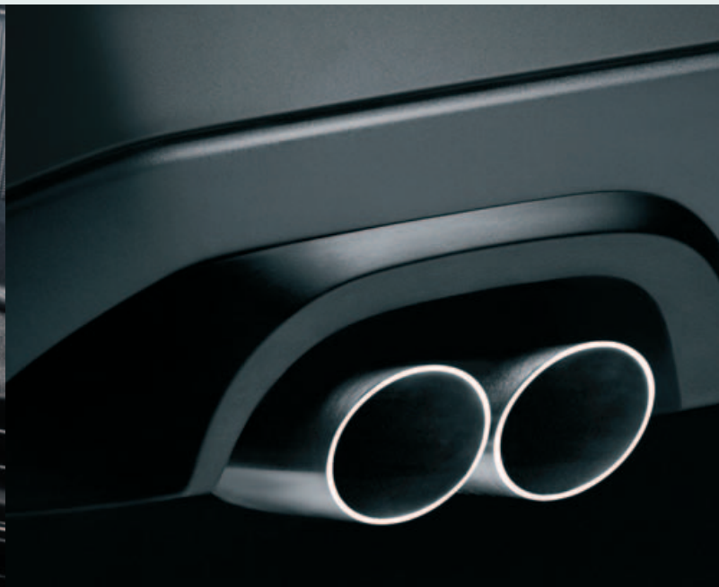
Dubbel uitgevoerde uitlaatpijp