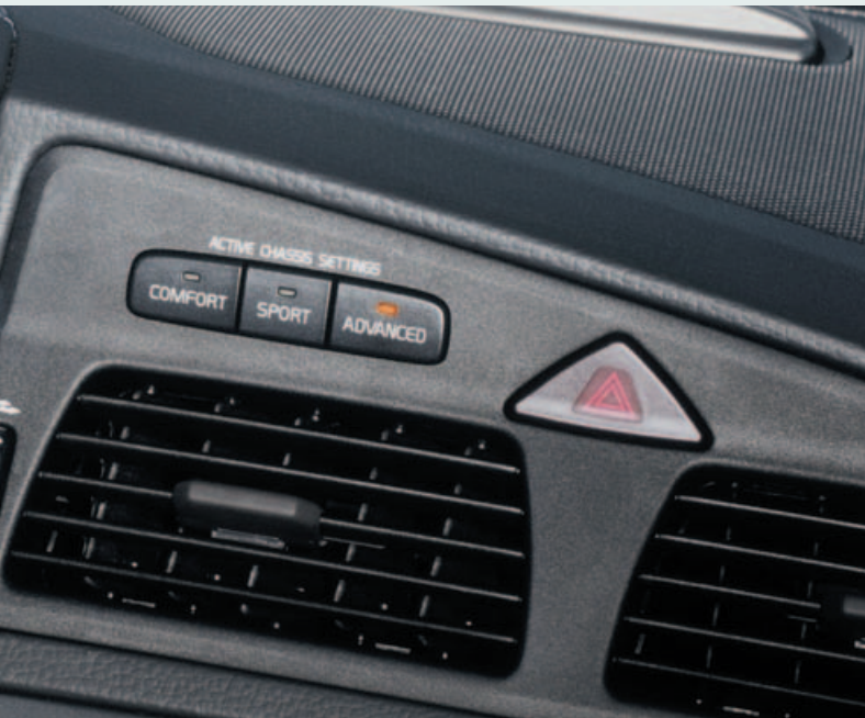
Four C systeem (Active Chassis-settings)