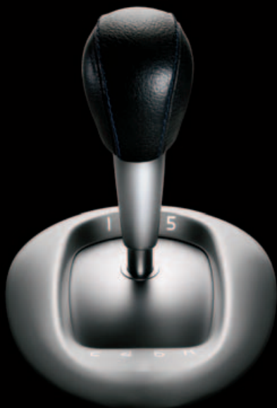
6-speed handgeschakelde versnellingsbak (spaceball)