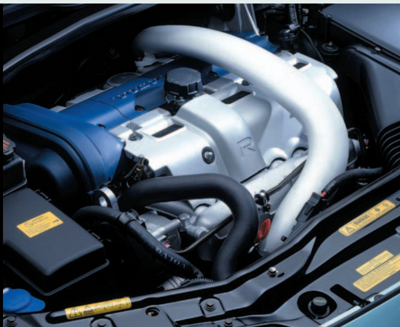
Motor met blauw kleppendeksel en R-logo